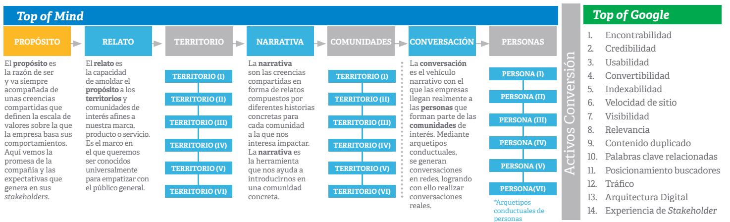
Figura 1. Del Top of Mind al Top of Google (I).

Todo se puede sintetizar en la hipótesis de que las empresas que no alcancen comprender que la comunicación de la era digital se centra en la creación de bases de datos de valor, están peligrosamente desorientadas frente a la evolución digital de sus clientes. Profundicemos, pues, en el primer desafío que planteo sobre la conversión que tienen que vivir las empresas en esta era de la transformación digital.