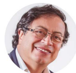
GUSTAVO PETRO Dirigente político y candidato de Colombia Humana

Gobierno en temas económicos y a toda la gestión en general. Fue asesor de Juan Manuel Santos cuando este era ministro de Hacienda, asesor de Álvaro Uribe ante la ONU y profesor asistente de sus clases en Georgetown University. Durante el Gobierno de Uribe pasó a trabajar al Banco Interamericano de Desarrollo en Washington durante 10 años.