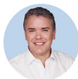
IVÁN DUQUE Presidente electo de la República de Colombia

Es abogado, magister en Derecho Internacional Económico y Gerencia Pública y formación continua en Negociación Estratégica, Políticas de Fomento y Gerencia del Capital de Riesgo.